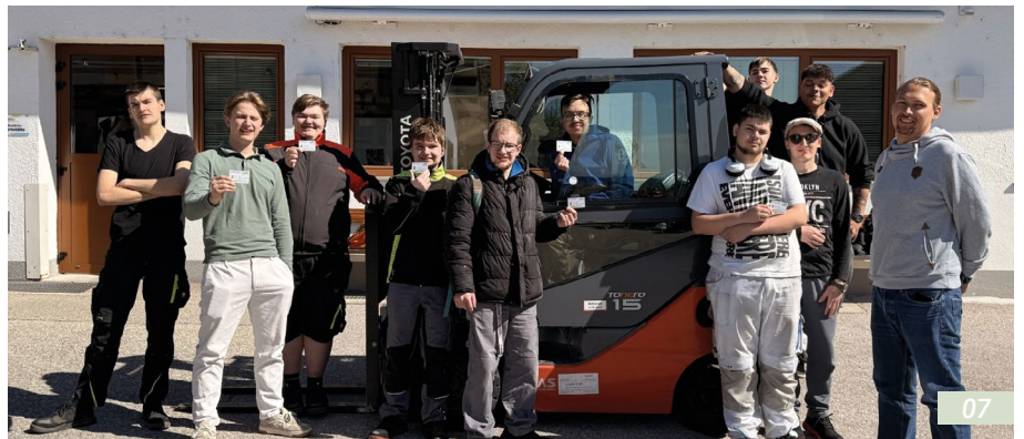
07 Erfolgreiche Absolventen des Staplerkurses Hof Tollet