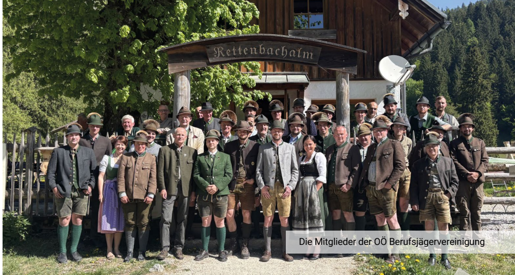
Die Mitglieder der OÖ Berufsjägervereinigung

Im Anschluss gaben Obmann, Geschäftsführer und Kassierin einen Rückblick auf das vergangene Jahr. Mit einer neuen Web-