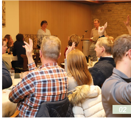
02 Teilnehmende der Betriebsversammlung